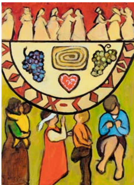
Titelbild von Rezka Arnuš zum Weltgebetstag 2019: © Weltgebetstag der Frauen – Deutsches Komitee e.V.

Mit der Bibelstelle des Festmahls aus Lukas 14 laden slowenische Frauen zum Weltgebetstag ein. Ihr Gottesdienst entführt in das Naturparadies zwischen Alpen und Adria, Slowenien. Und er bietet Raum für alle. Es ist noch Platz – besonders für all jene Menschen, die sonst ausgegrenzt werden wie Arme, Geflüchtete, Kranke und Obdachlose. Die Künstlerin Rezka Arnuš hat dieses Anliegen in ihrem Titelbild symbolträchtig umgesetzt. In über 120 Ländern der Erde rufen ökumenische Frauengruppen damit zum Mitmachen beim Weltgebetstag auf.