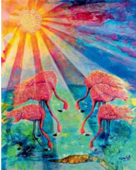
Titelbild zum Weltgebetstag 2015 von den Bahamas, „Blessed“, Chantal E. Y. Bethel/ Bahamas, © Weltgebetstag der Frauen

Traumstrände, Korallenriffe, glasklares Wasser: das bieten die 700 Inseln der Bahamas. Sie machen den Inselstaat zwischen den USA, Kuba und Haiti zu einem