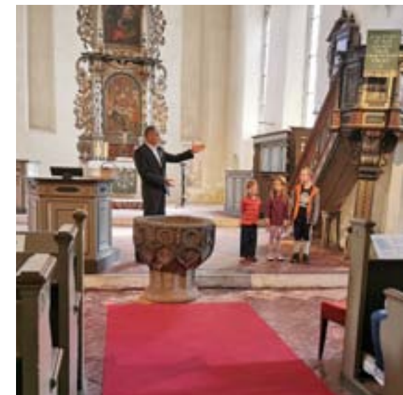
Die Schulanfänger werden vorgestellt

gesungen werden durfte, bekamen Kinder, Pädagogen und Interessierte einen kleinen bunten Fisch.