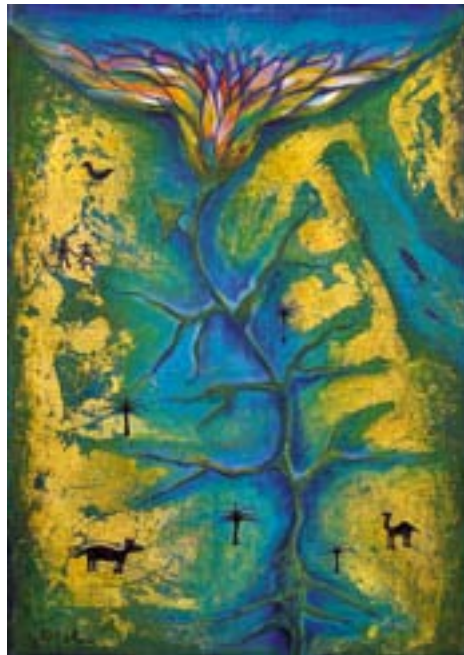
Schönheit und Vitalität Ägyptens will das Titelbild der jungen ägyptischen Künstlerin Souad Abdelrasoul zum Thema Wasserströme in der Wüste illustrieren. © WGT e.V.

Ägyptens Geschichte und Kultur begannen zwar lange vor biblischen Zeiten, sie sind aber auch eng verwoben mit dem Christentum. In Ägypten, wo rund 90 Prozent der Bevölkerung muslimisch sind, gehören zirka zehn Prozent christlichen Kirchen an, als deren Begründer der Evangelist Markus gilt. Die größte unter ihnen ist die